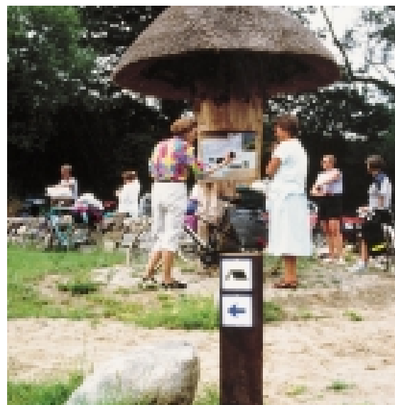
Kort bør være let tilgængeligt.

Endvidere påføres de vigtigste trafikmål for såvel lokale som turister. Signaturforklaring tilføjes gerne på dansk, engelsk og tysk, selvom kortene især henvender sig til lokale.