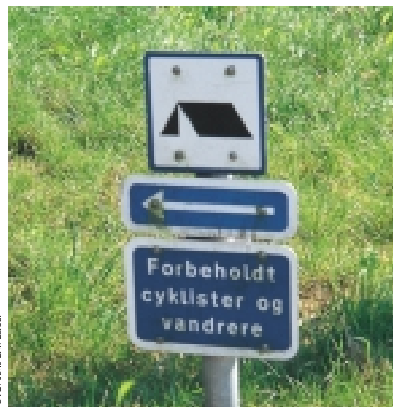
Teltplads til venstre.

Cykelkort for byområder er vigtige for beboere og tilflyttere, som ikke kender stisystemerne. Kortene skulle gerne vise vej, motivere til at cykle og give mulighed for bedre oplevelser. Kortene kan give ideer til afprøvning af forskellige ruter og kan benyttes på søndagscykelturen ud af byen. Kortene kan vise hvor aflåst/ overvåget/god cykel-parkering findes, så byturen ikke giver bekymringer for tyveri.