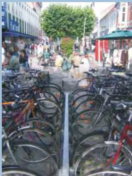
Gode cykelparkerings forhold er et vigtigt element i cykelhandlingsplanen for Fredericia

Fredericia Kommune har lavet en cykelhandlingsplan. Listen over påtænkte projekter indeholder bl.a. millionprojekter som f.eks. en række nye cykelstier, projekter om bedre afmærkning, flere chikaner og elektroniske trafiktavler.