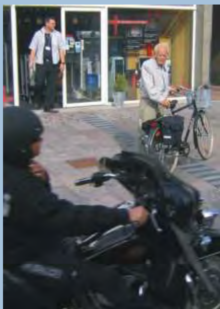
Cykling er et spørgsmål om livsstil

Fredericia Kommune har i en årrække gjort en stor indsats for at udbygge faciliteterne for cykeltrafikken og for at forbedre trafiksikkerheden, men betingelserne for fortsatte forbedringer og fastholdelse af den gunstige udvikling er, at der foretages en langsigtet og koordineret indsats på cyklistområdet og med